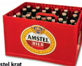
Amstel krat 24 flesjes à 0.3 liter**

Spotta kan ook dynamische linkjes in de folders aanmaken naar websites, webpagina's, pop-ups en video's (in overleg met je accountmanager).